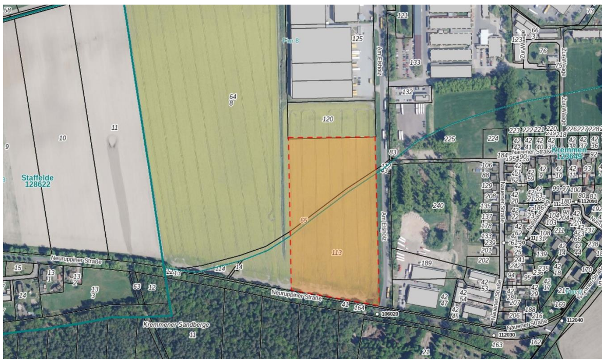
Luftbild in Überlagerung mit der Liegenschaftskarte mit Kennzeichnung des geplanten Geltungsbereichs