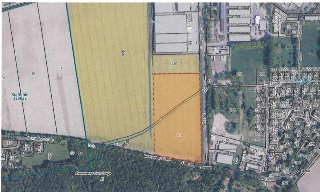
Luftbild in Überlagerung mit der Liegenschaftskarte mit Kennzeichnung des geplanten Geltungsbereichs