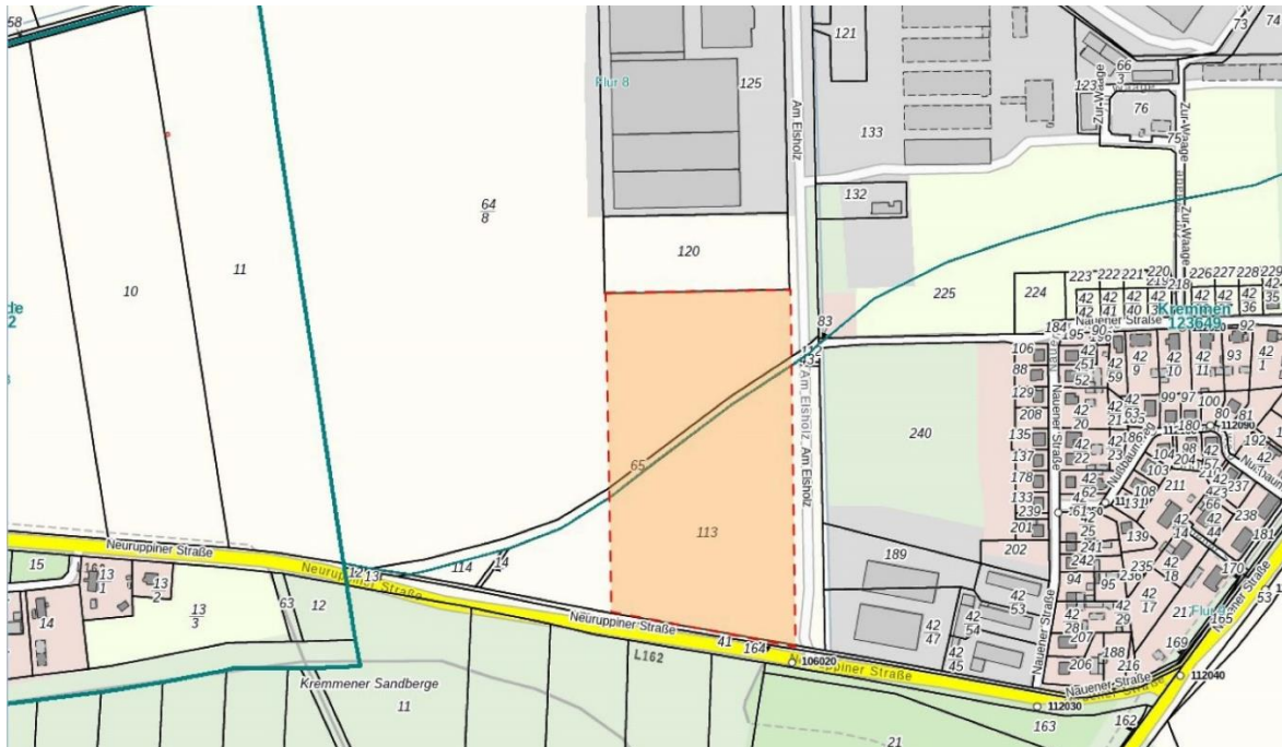
Ausschnitt aus der Liegenschaftskarte in Überlagerung mit der topografischen Karte mit Kennzeichnung des geplanten Geltungsbereichs