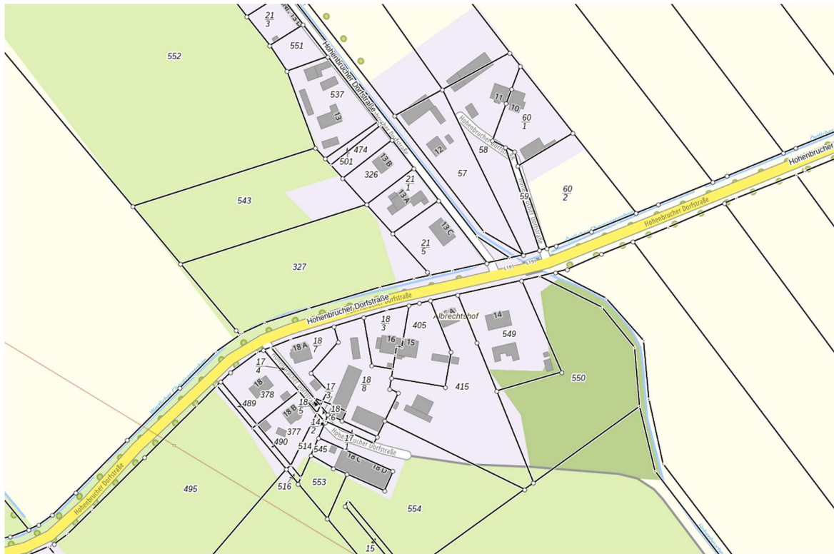
Abbildung 3 Auszug Brandenburg-Viewer mit Liegenschaftskataster