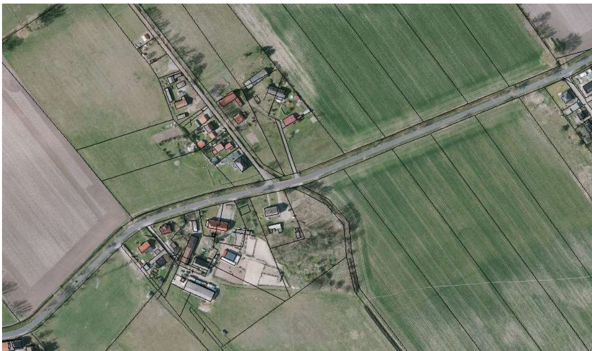
Abbildung 2 Auszug KfLis mit Luftbild