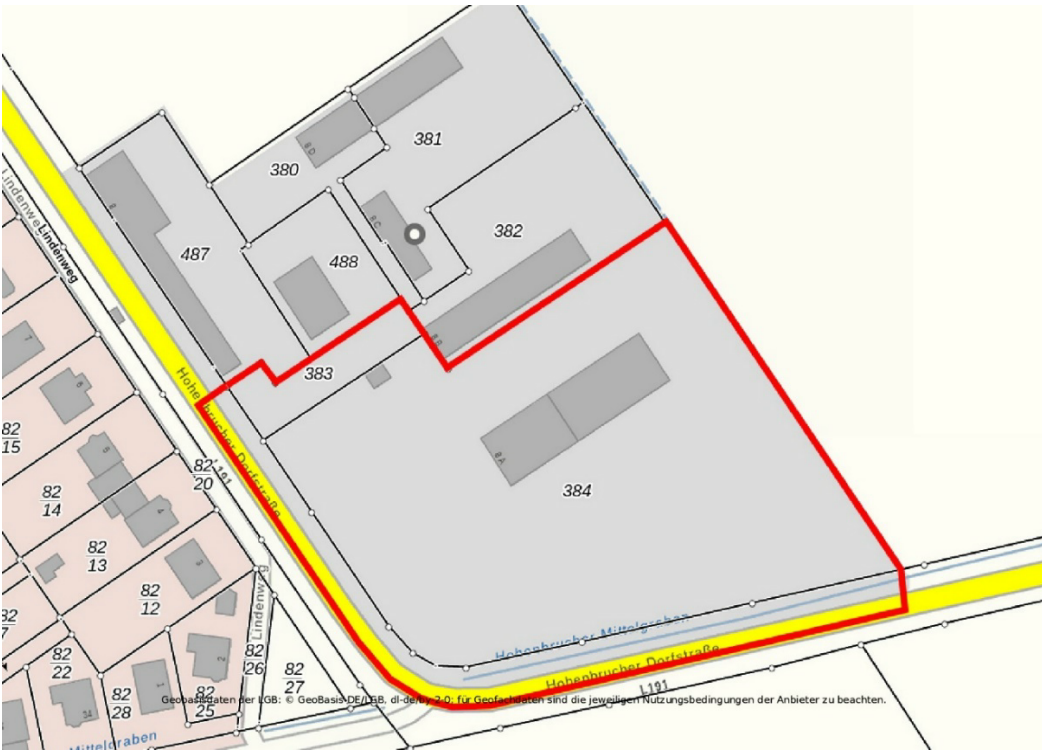
Ausschnitt aus der Liegenschaftskarte mit Abgrenzung des vorgesehenen Geltungsbereichs unter Einbeziehung der angrenzenden öffentlichen Straßenverkehrsfläche