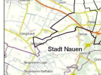
Übersichtslageplan (Kartengrundlage: Web)