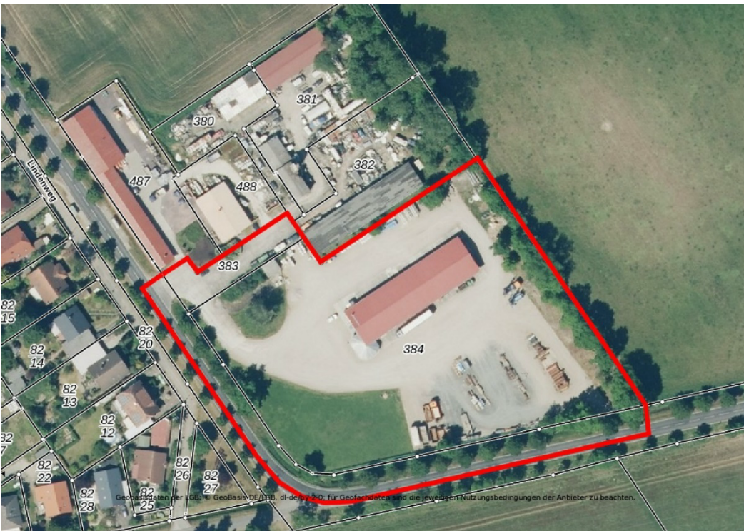
Luftbild mit Abgrenzung des vorgesehenen Geltungsbereichs (DOP20c - Befliegung 14.05.2025)